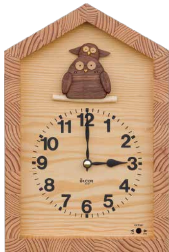
K202 フクロウの親子の時計(クォーツ・カッコー)

本体価格 ¥30,000(税込 ¥33,000 ) W230×H350×D95mm 約2kg