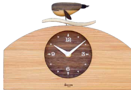
K121 くじらの時計(クオーツ)

しっぽを揺らして時間を見つめる可愛い仔猫の小さな時計です。繊細な仕草を丁寧に仕上げています。