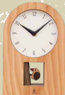
K1005 キツツキの時計(クオーツ)

小さな森で拾った小枝と落ち葉をイメージしてつくった針を取り付けています。キコリ創業以来引き継がれているカラ松の木口を生かしたデザインが特徴の森を感じる時計です。