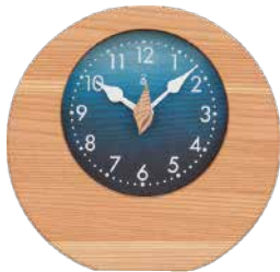
K205 海の置時計(クオーツ)

本体価格 ¥12,000 (税込 ¥13,200 ) W180×H170×D50mm 約0.5kg