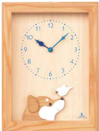
K480 柴犬と白文鳥の時計(クオーツ)

本体価格¥18,000(税込¥19,800) W255×H335×D70mm 約1.5kg