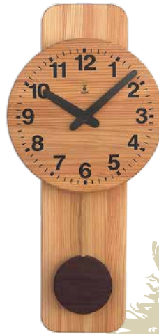
K585 丸型時計(クオーツ)

親子のさかなが左右に揺れながら、会話するように口をパクパクと開いたり閉じたりします。