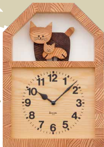
K910 ネコの親子の時計(クオーツ)

幸せを運ぶといわれる青い鳥が文字盤にとまった時計です。青い鳥がゆっくりと揺れて穏やかな時間が流れます。