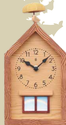
New!! K308 雨あがりの時計(クオーツ)