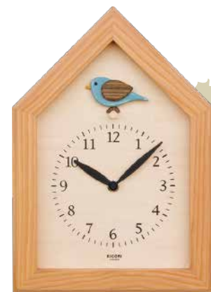
K207 青い鳥の時計(クオーツ)

カラ松は木工品の素材としては扱いが難しい木なのですが、キコリでは独自の技術を駆使してこの木を生かしたオリジナルデザインの時計をもう四十年以上もつくり続けてきました。