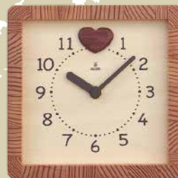
K820 ハートフル時計(クオーツ)

本体価格 ¥12,000 (税込 ¥13,200 ) W180×H180×D55mm 約0.5kg