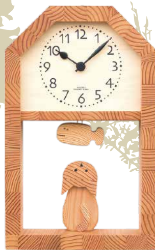
K259 ネコとサカナの時計(クオーツ)

仔猫が左右に動くと親猫が見守るように顔を振りまわります。 見やすい文字盤で、ロングセラーを続けるキコリの定番の時計です。