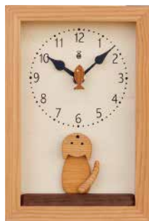
K156 仔猫の時計(クオーツ)

海をイメージした青い文字盤、木で作った巻貝の秒針、まるで海の中にいるような時計です。小さめの時計ですので、デスク周り等に置くのもおすすめです。