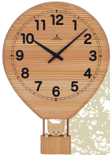
K185 気球の時計(クオーツ)

本体価格 ¥30,000 (税込 ¥33,000 ) W350×H500×D55mm 約2kg