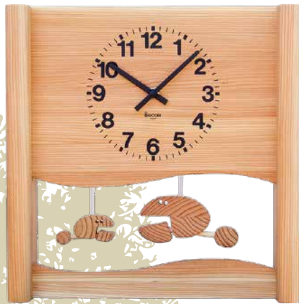
K184 さかなの親子の時計(クオーツ)

大きな文字盤を無垢材でつくりました。気球に乗ったネコが、顔を振りながら見下ろしています。