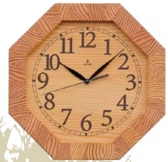
K119 八角時計(クオーツ)

厚めの無垢板の文字盤にシンプルな数字、ウォルナットの振子が揺れる重量感のある時計です。