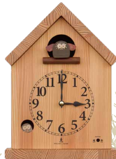
K142 バードハウスの時計(クオーツ・カックー)

信州の森に棲んでいるという青い鳥が時を告げるカックー時計です。毎正時と半時に青い鳥が出てきて、可愛い草草と澄んだ鳴き声で幸せを呼び込みます。